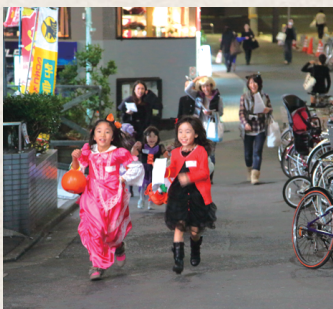
子どもたちが仮装して町内をまわるハロウィン

会員が増えると財政的にも潤いますし、協力者が増えることでできることが増えていきます。町会運営で大切なことは、1つには垣根を作らないこと。町会をまたいで参加してもらえらる行事があることです。2つめは次世代の人材を育てて、運営をまかせていくこと。リーダーシップが取れる人がいると町会運営というのはスムーズに進んでいくんじゃないかと思っています。最近、結婚して出て行った息子世代が、行事になると帰ってくるというケースも多い。彼らの帰ってくる場所として「都会のふるさと」の祭りは大切にしていかなければと思いますね。