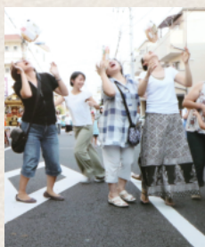
車通りの少ない通りを使って、パン食い競争を行なったことも

今はバス旅行やキャンプといってもなかなか集まりませんね。逆に言うと、町内から出ないでやったほうが人が集まるようです。水鉄砲を作って遊んでみようとか、パン食い競争をやってみたり、試行錯誤しながら若い世代に参加してもらえる催しを行なっています。子供たちは、自分の家では掃除をしたこ