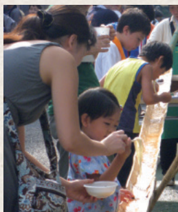
秋まつり行事のひとつ、流しそうめんは大好評

茗荷谷町会には「次世会」という若い世代の活動が活発です。若い人に任せて、発案、実行、運営までやってもらおう。予算の枠だけを示して、例えばこのイベントは5万円ですべて賄ってくださいと任せてみると、きちんとやってくれるんです。ハロウィンやお祭りをはじめとして、運営はすべて若い世代にお任せしています。私は、町会活動は異業種交流の場でもあると思っています。仕事以外の人と触れ合え、活動を共にすることがいい意味で刺