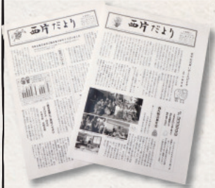
毎月発行の「西片だより」はHPでアーカイブが見られます

昨年60周年を迎え、再建の頃より毎月発行している「西片だより」も680号を超えました。最近では相続の関係でマ