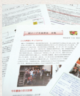
自分たちで編集・制作し、町会の活動を身近に伝えるタウン誌

今年「子育て」をテーマに、老朽化した空き家をリノベーションで甦らせ、若い人たちに集ってもらえる場所を作る「空き家プロジェクト」を行なっています。20〜30代の空き家活用に興味のある若い人を外部からも取り入れて、のべ100人ほどが参加。地域のために