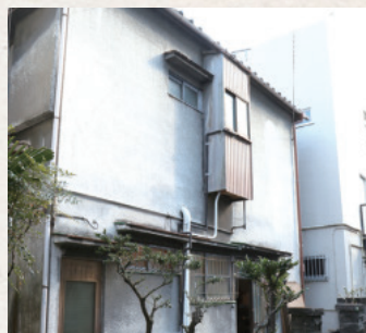
「地域のために使って」と大家さんの御厚意で提供された空き家

地域の活性化には、町と商店街が一緒になって良くなっていくことが大事だと思っています。若い世代から出てきたアイデアをいいと思ったらすぐ実行にうつす、アクティブな行動ができなければダメ。今年の節分会では、鬼に扮した若い人たちが「鬼カフェ」と称してお茶を振舞い、大好評でした。3月にはBBQ大会も行います。節分会、お地蔵さんの大祭、七夕と商店街もこれまで、さまざまな催しを行なってきました。エコキャンダルを灯してクリスマスツリーに見立ててみたり。最近秋のふるさとまつりとハロウィンをくっつけようかという話も出ています。やはり、商店街にイベントは不可欠だと思っているので、これからもさまざまな企画で町おこしをしていきたいですね。