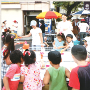
水鉄砲で遊んだり、納涼広場には近隣の子どもたちも集まる

僕は、町会のキャンプに行く時も、自分の子どもにも「お父さんは、一緒に行くけど、お前たちのことは特に見ないよ」と言い聞かせていました。自分の子ども以上によその子が怪我しないように注意しないといけないから。自分の子どもだけを見守っているよりも、周りのみんなが自分の子以外を見守っているほうが実は安全だったりします。これはボランティアでもNPOでも同じこと。大きな災害が起きた時、みんなが避難民になった時に助け合えるのが町会です。普段から防災訓練や避難所運営も含め、町会活動を通して結びつきを強めておくことは大切だと思います。