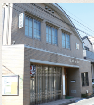
町会活動の拠点となっている、立派な西片会館

また、住宅地としてはいち早く防犯カメラを導入。防災部と防犯部を分けました。防犯に熱心な方、コンピューターに明るい方など、人員配置は適材適所が大事です。今は町内を8地区に分けて理事を配置しております。これほど立派な会館を持つ町会というのも珍しいと思いますので、ここを拠点に活発に活動していただきたいと思います。