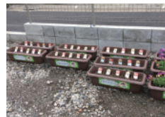
写真は後楽四丁目協力会憩いの広場